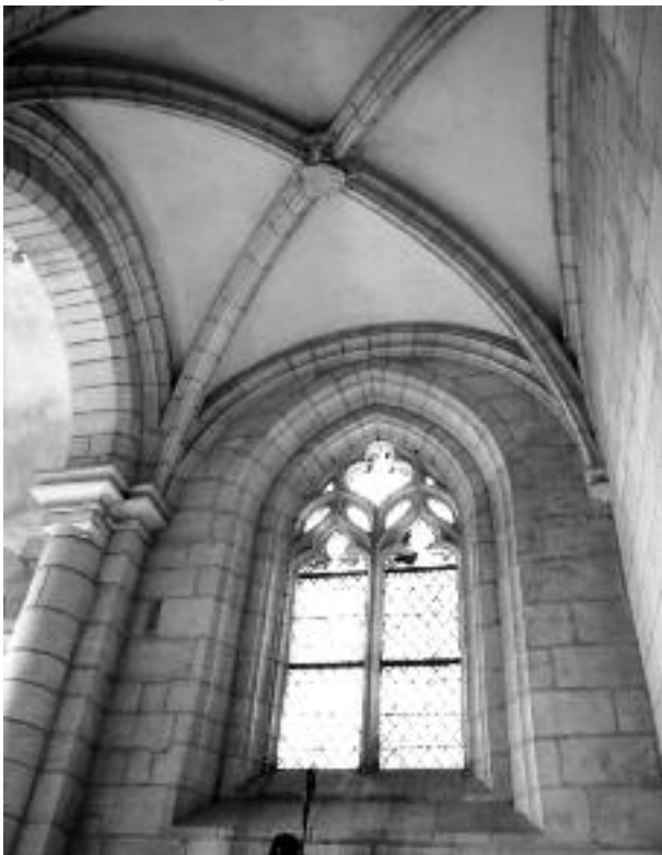
Cl. É. Vergnolle.