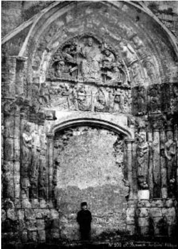
Fig. 5 - Saint-Benoît-sur-Loire, le portail nord de la nef à la fin du XIX e siècle.