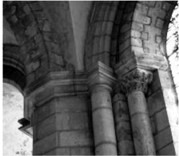
Cl. É. Vergnolle.