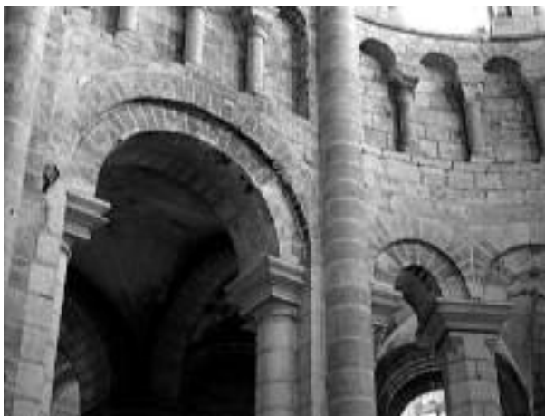
Fig. 2 - Saint-Benoît-sur-Loire, hémicycle, côté nord.